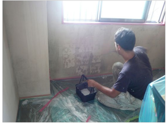
「カビ止めシーラー」を塗布